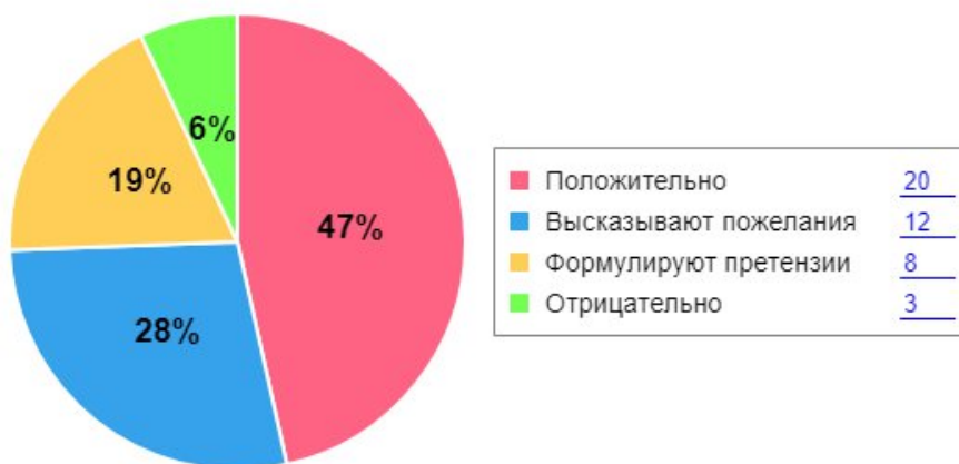
Как родители оценивают детский сад

Вывод: в МБДОУ детский сад «Малышок» р.п. Мокшан выстроена четкая система методического контроля и анализа результативности воспитательно-образовательного процесса по всем направлениям развития дошкольника и функционирования МБДОУ детский сад «Малышок» р.п. Мокшан в целом.